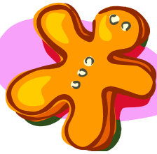
un pain d'épices