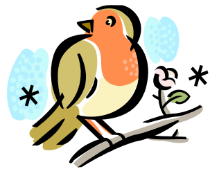
un rouge gorge