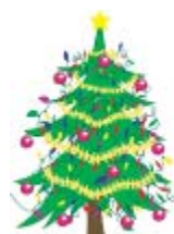
un arbre de Noël