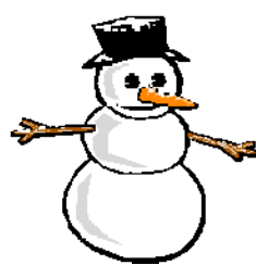
un bonhomme de neige