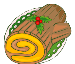
la bûche de Noël