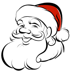
le père Noël